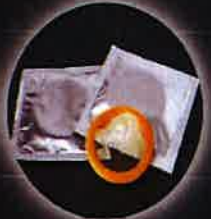
Préservatifs et autres ...