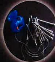
Fil dentaire, coton-tiges