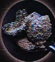
Litière pour chat