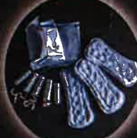
Tampons et serviettes hygiéniques