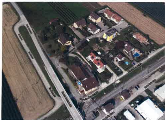
Figure 2 - Quartier En Convers

La planification d'un vrai lien de mobilité douce ne pourra que renforcer la cohésion communale et consolider l'identité du village.